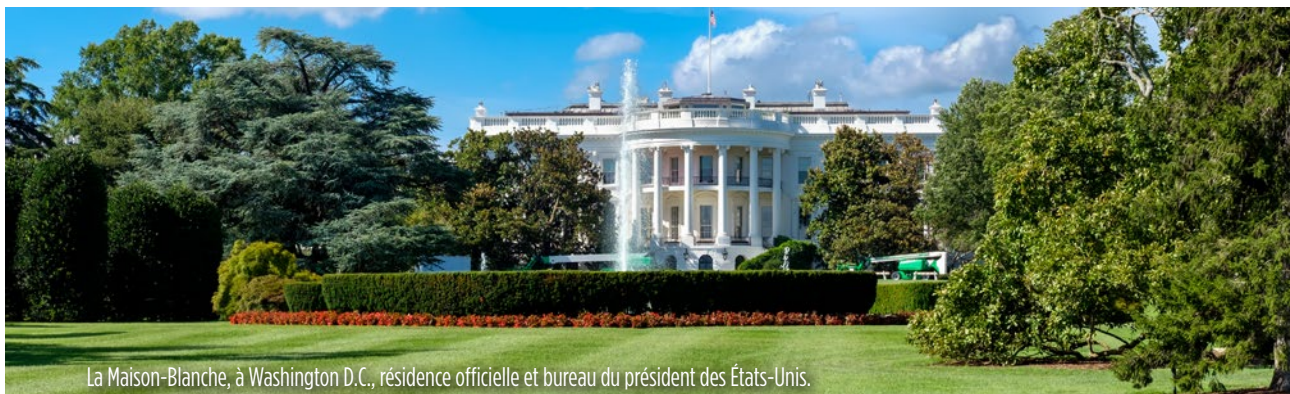
La Maison-Blanche, à Washington D.C., résidence officielle et bureau du président des États-Unis.

briller au sommet d'une colline comme un exemple des lois et de l'amour de Dieu en action, la nation a été l'exemple d'un pays comme les autres, mangeant de l'arbre de la connaissance du bien et du mal, tout en profitant des bénédictions imméritées de son ancêtre Abraham. Les États-Unis n'ont pas exporté le mode de vie divin, mais le mode de vie américain . Ceux qui sont incapables de voir les vraies différences entre ces deux modes de vie sont profondément désorientés.